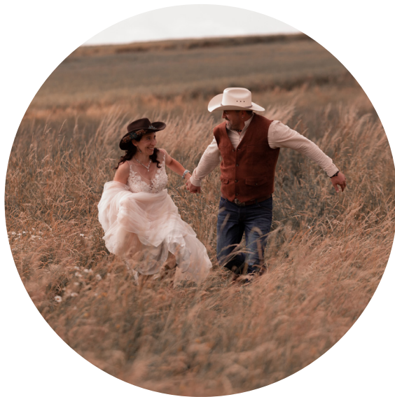
sunset red Das gesamte Bild bekommt einen rotbraunen Flair

Eine Bildübergabe in Originaler Bildfarbe ist nicht möglich.