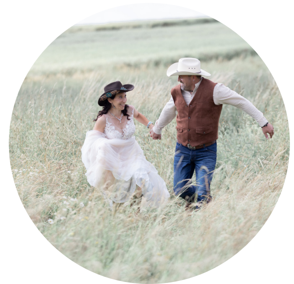
Clean White Alle Farben bleiben den Ursprungsfarben er- halten, der Grünerton ist etwas heller