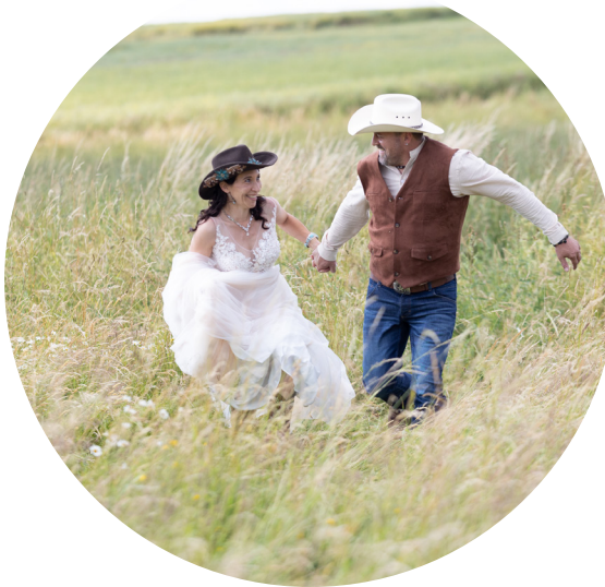
Original Es werden keine Bilder im Originalzustand übergeben